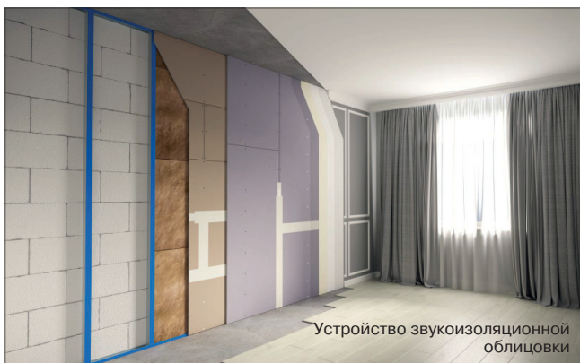
Устройство звукоизоляционной облицовки

ционными характеристиками; Аквамарин – новый лист с пониженным водопоглощением, который сейчас выводится на рынок; новый лист и целая система, которую назвали «Шахтная стена».