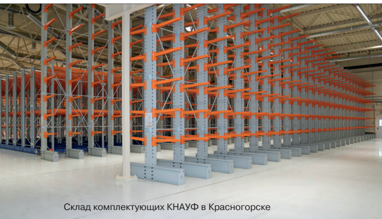
Склад комплектующих КНАУФ в Красногорске

Проведя анализ рынка основного продукта, гипсокартона, в КНАУФ установили, что он за последние 10 лет держится примерно на одном уровне. И в 2024 г. поставлена амби-