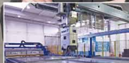
Автоматизированная линия циркуляции для производства готовых железобетонных изделий