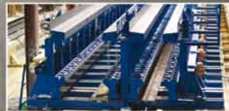
Стационарные решения установок для производства готовых железобетонных изделий